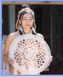
Sorairo kamyu 空色カミュ